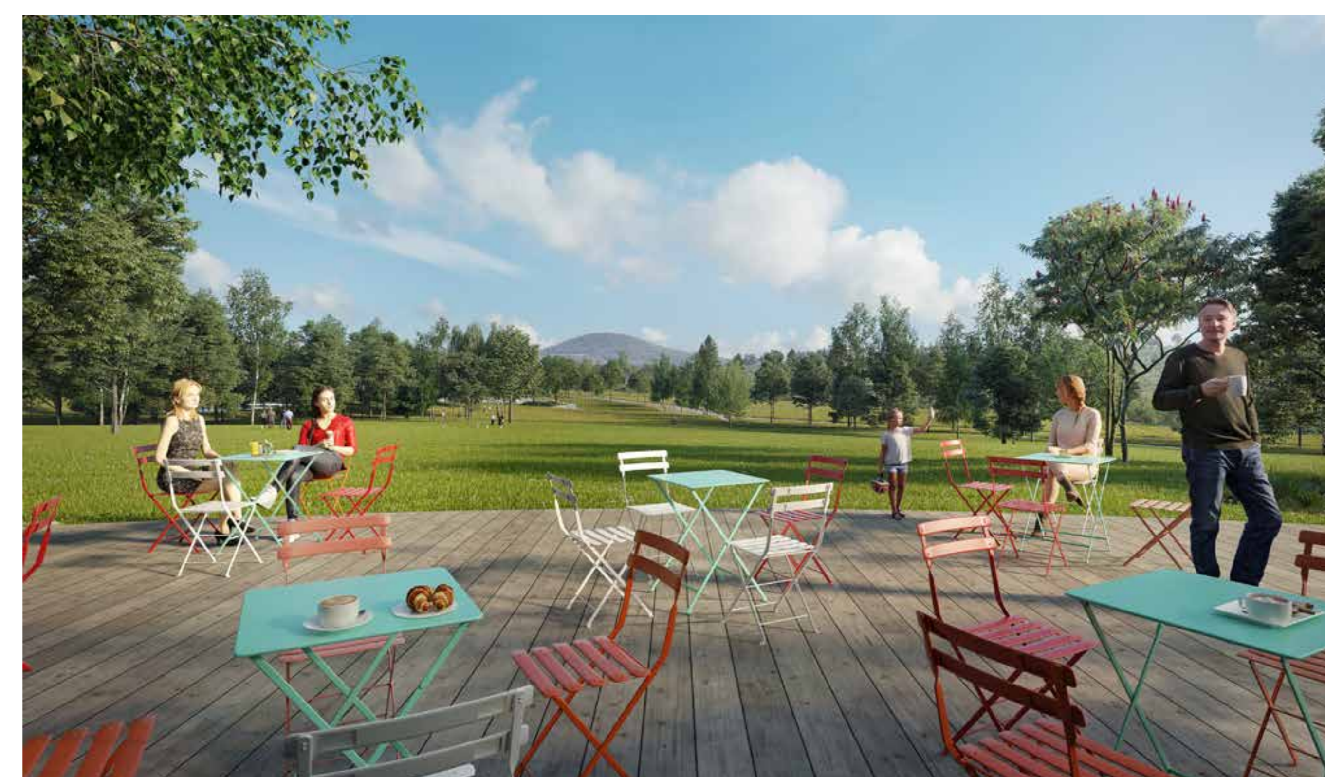
výhled z kavárny směrem k řípu

Intenzivně zemědělsky obhospodařované pole musíme nejprve přeměnit na půdu vhodnou pro založení lesoparku. Je třeba nastavit její rovnováhu a obohatit ji o organickou složku. K tomu využijeme čas, během kterého bude vznikat projekt nového lesoparku, zatímco půda se již bude proměňovat.