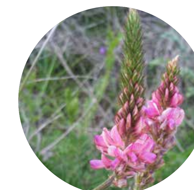
vičenec ligrus Onobrychis viciifolia