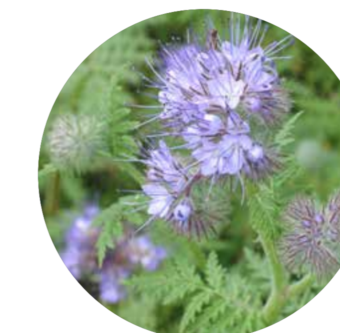
svazanka vratičolistá Phacelia tanacetifolia