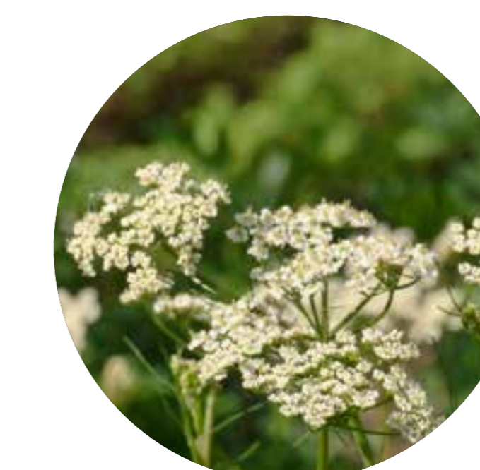
kmín kořený Carum carvi