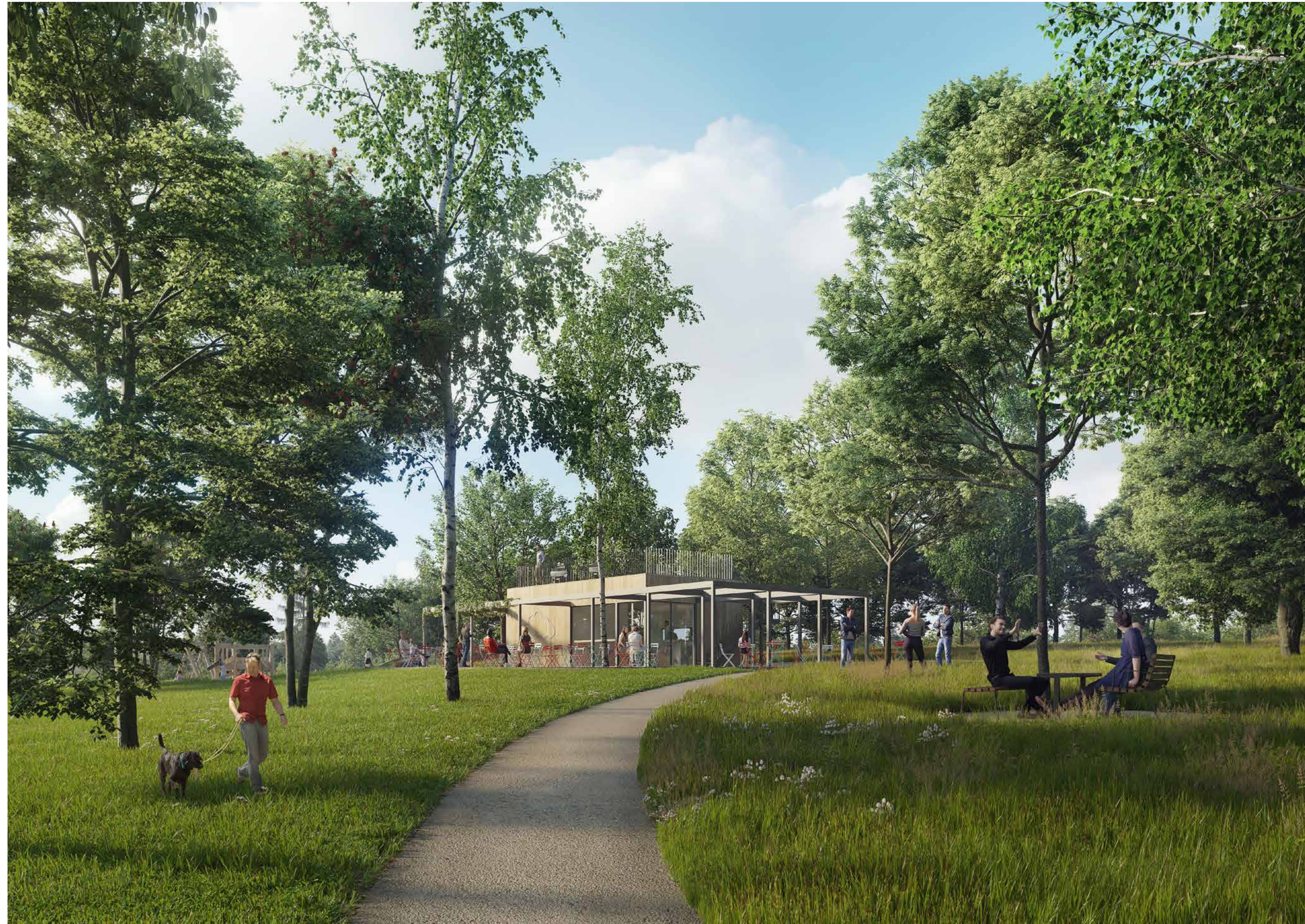
na měkké cestě pod korunami stromů směrem ke kavárně