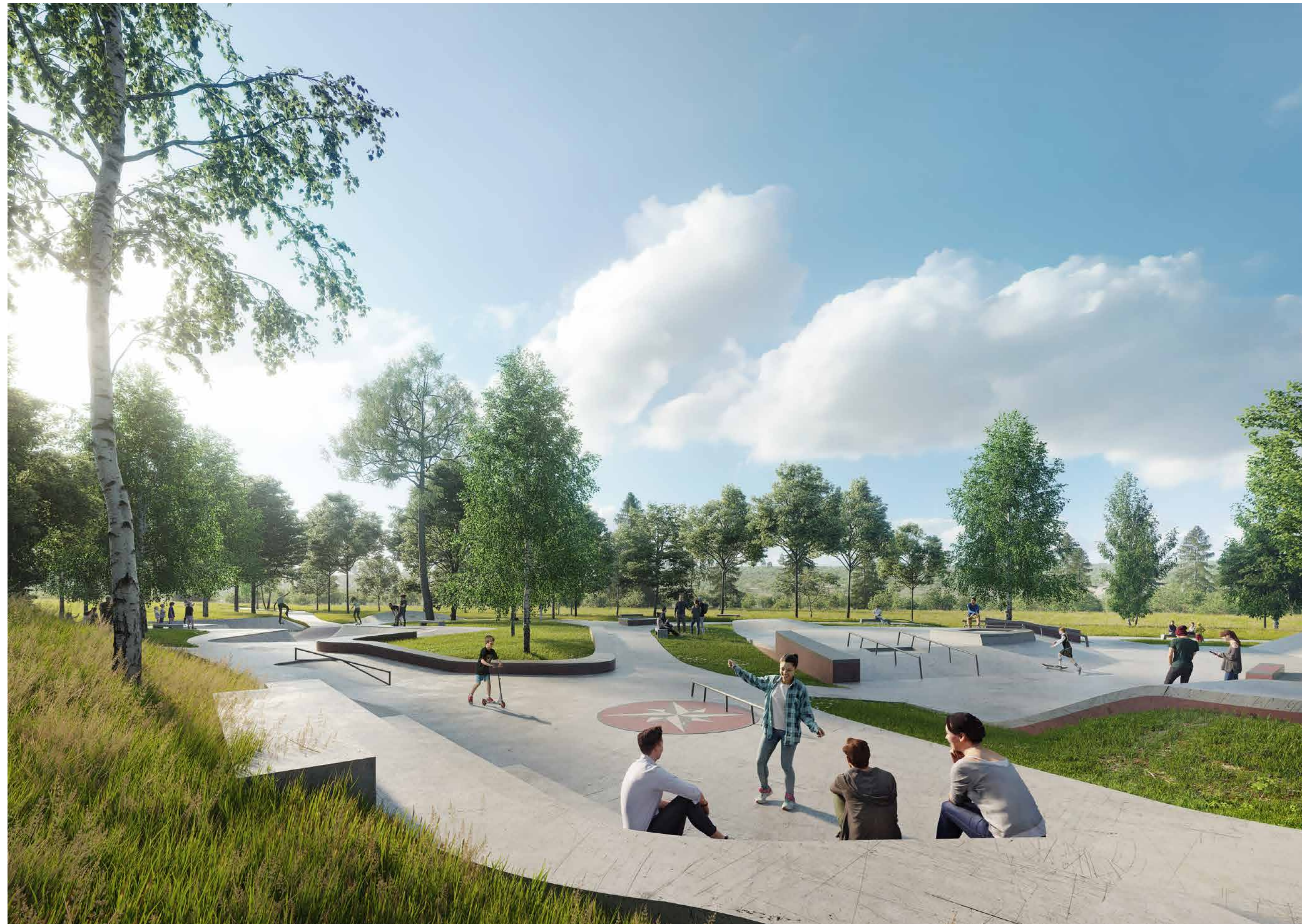
vizualizace nového roudnického skateparku