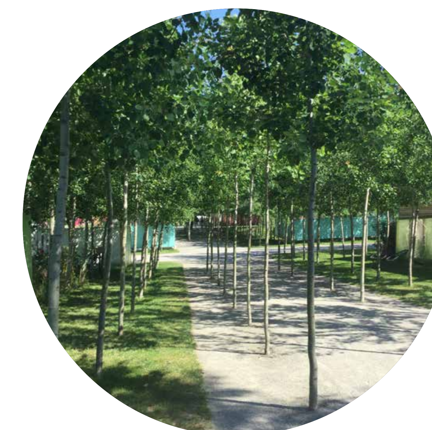
reference mladého lesa BUGA Heilbronn, Německo