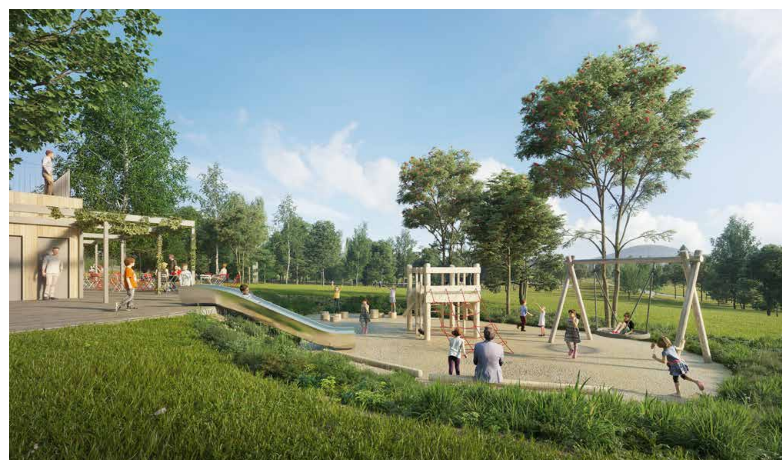
pohled na dětské hřiště s kavárnou