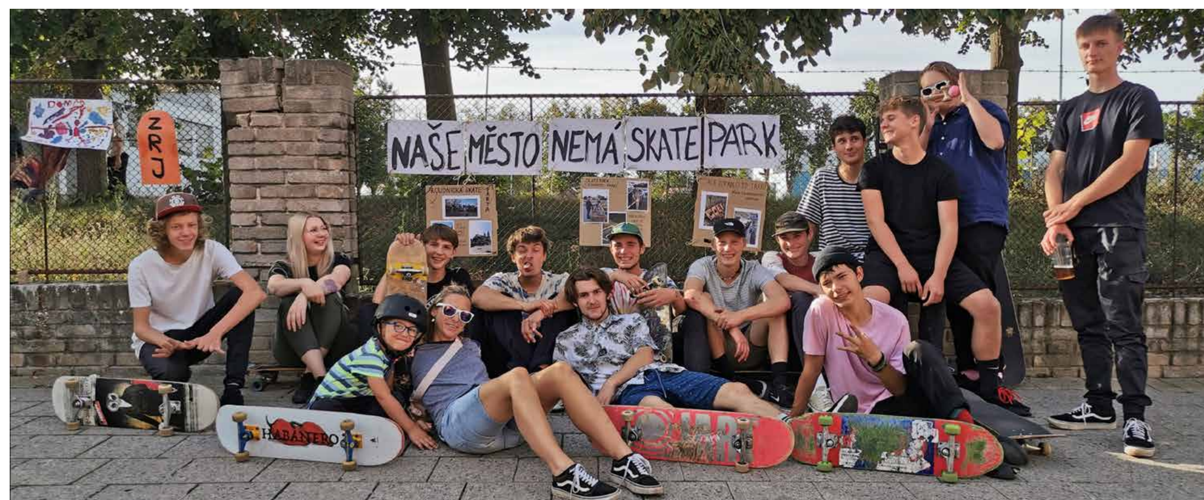
roudnická komunita skejtáků

Nový, velkoryse pojatý skatepark je splněným snem roudnické skejtové komunity. Návrh skateparku vychází z představ této komunity a je navržen profesionály z Mystic constructions.