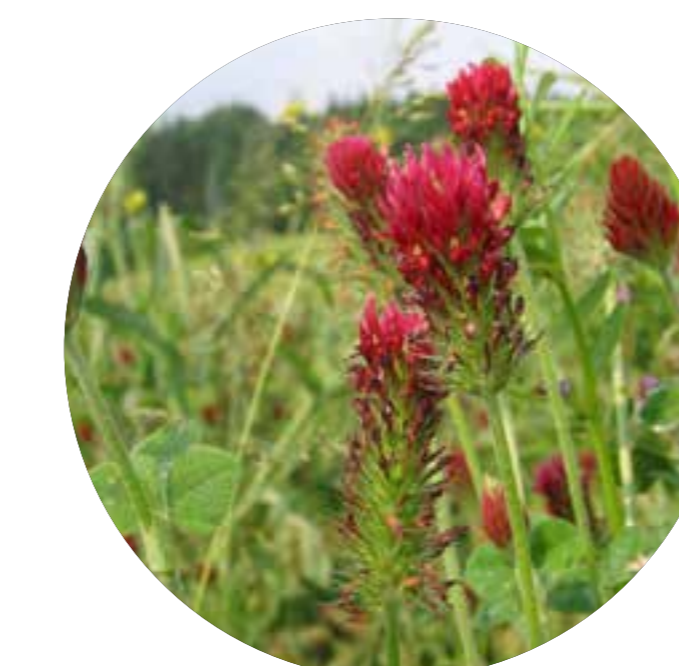
jetel inkarnát Trifolium incarnatum

Park samotný pak bude založen pomocí pionýrských dřevin (např. olše, břízy, jasany, vrby apod.), které svým rychlým růstem brzy poskytnou stín a vytvoří příznivé prostředí pro růst cílových dřevin. Postupně, zhruba po deseti letech, mladý les vystřídají dlouholeté dřeviny jako jsou duby, javory, ořešáky, lípy, habry, hlohy, jilmy a třešně a nakonec i borovice lesní. Tyto stromy budou následně zapěstovány tak, aby naplnily záměr a z pole se stal lesopark.